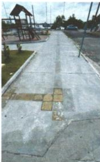
Fotos 4 e 5 - Piso tátil danificado