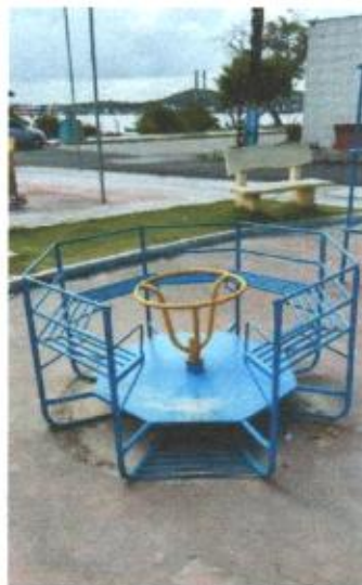
Fotos 1, 2 e 3 - Brinquedos quebrados