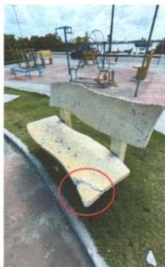
Foto 6 - Banco danificado