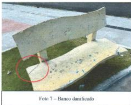
Foto 7 - Banco danificado