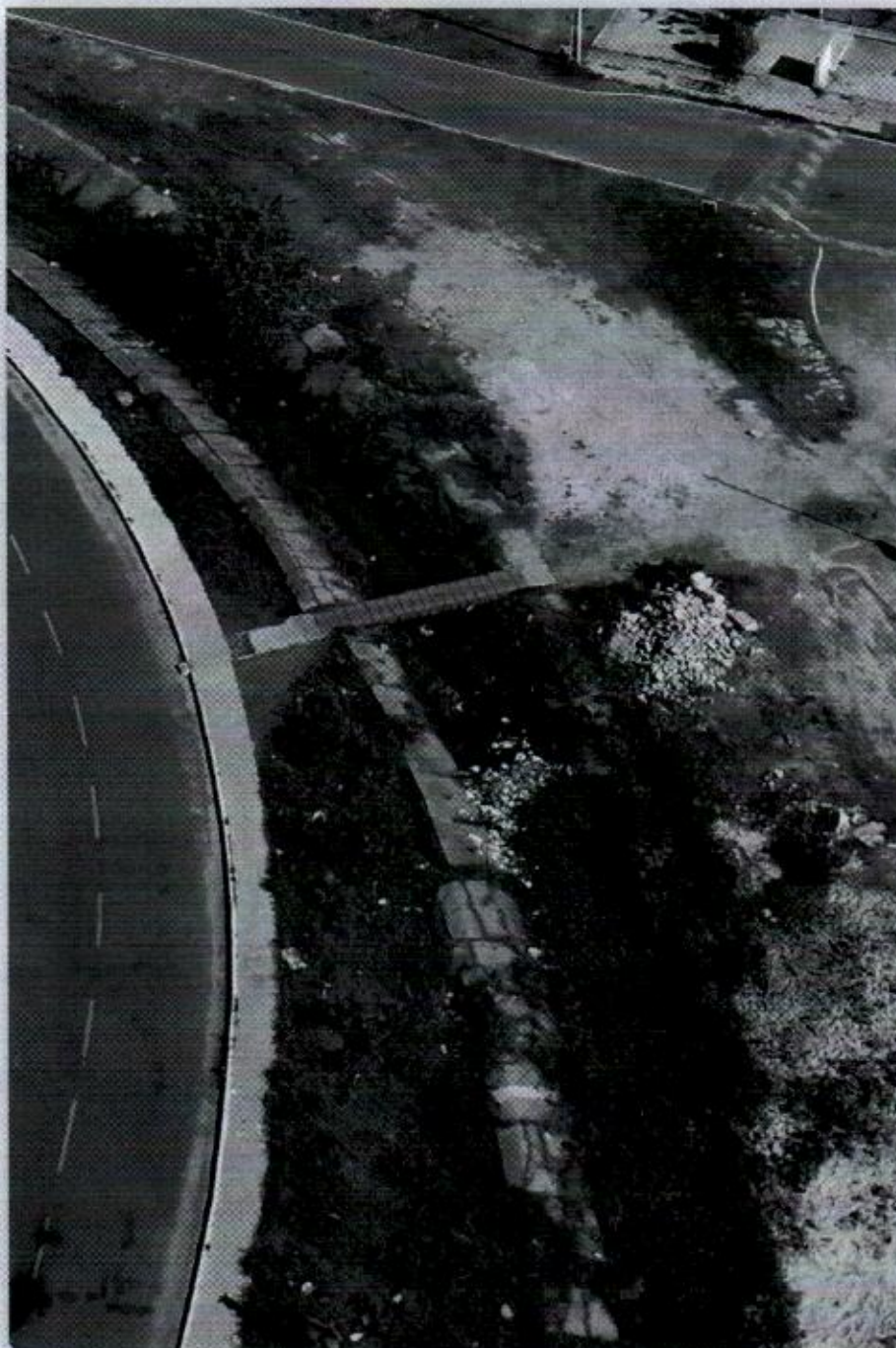
Foto 4 - Ponte entre a quadra do Conj. Marcelo Deda e a Escola Maria Raimunda