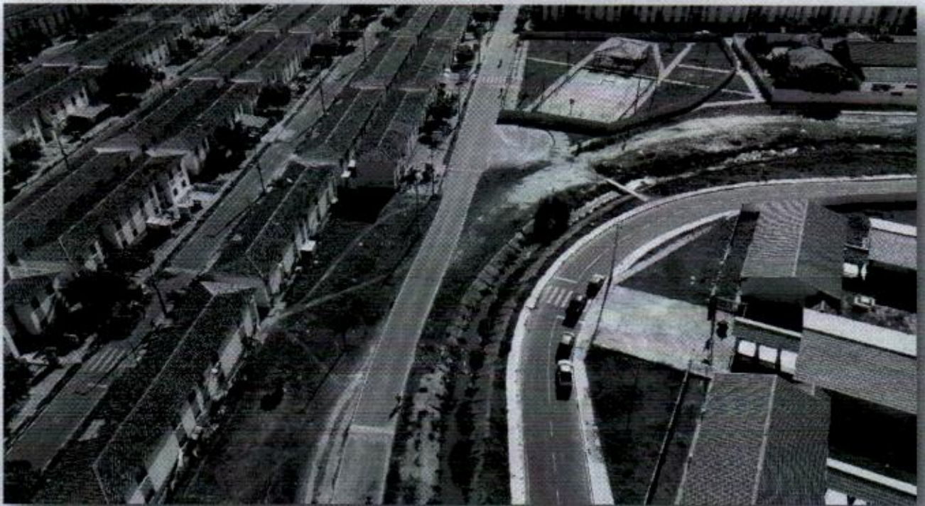
Foto 5 - Marcelo Déda (proximidades da quadra, Escola Maria Raimunda e Creche Ester Martins)