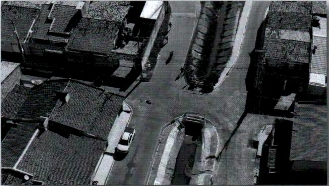
Foto 6 - Encontro entre os conjuntos Marcelo Deda e Prisco Viana